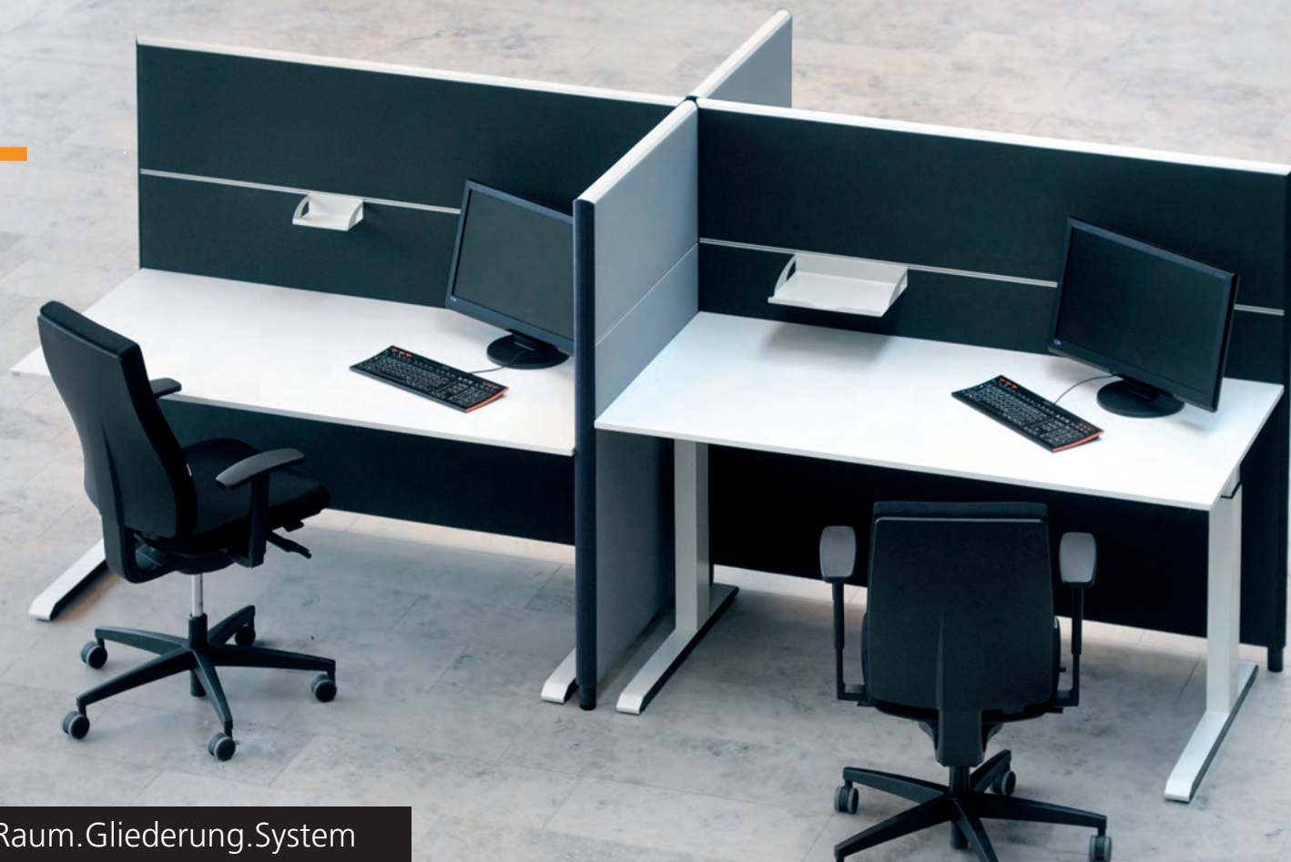
SILENCE LINE Raum.Gliederung.System