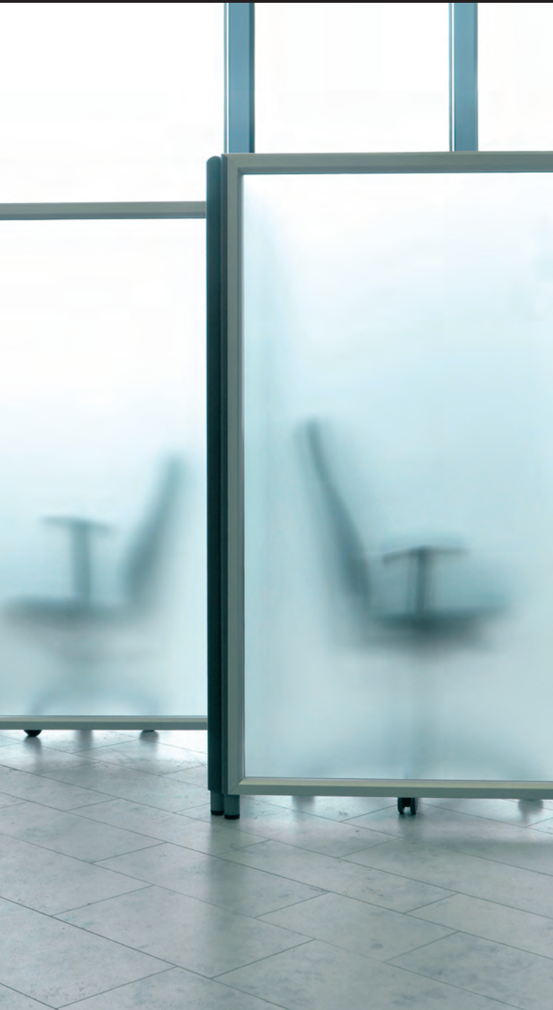
SILENCE LINE Raum.Gliederung.System

Mehr Effizienz durch bessere Arbeitsbedingungen – das ist Ziel und gleichzeitig Lösungsansatz für unsere Dienstleistungen und Produkte. Wir beraten, planen, entwickeln und produzieren flexible Raumgliederungssysteme für Büros, Großraumbüros, Call-Center, Einzel- und Gruppenarbeitsplätze sowie Besprechungsbereiche. Unsere Kernkompetenz liegt im Bereich der individuellen und ganzheitlichen Akustiklösungen.