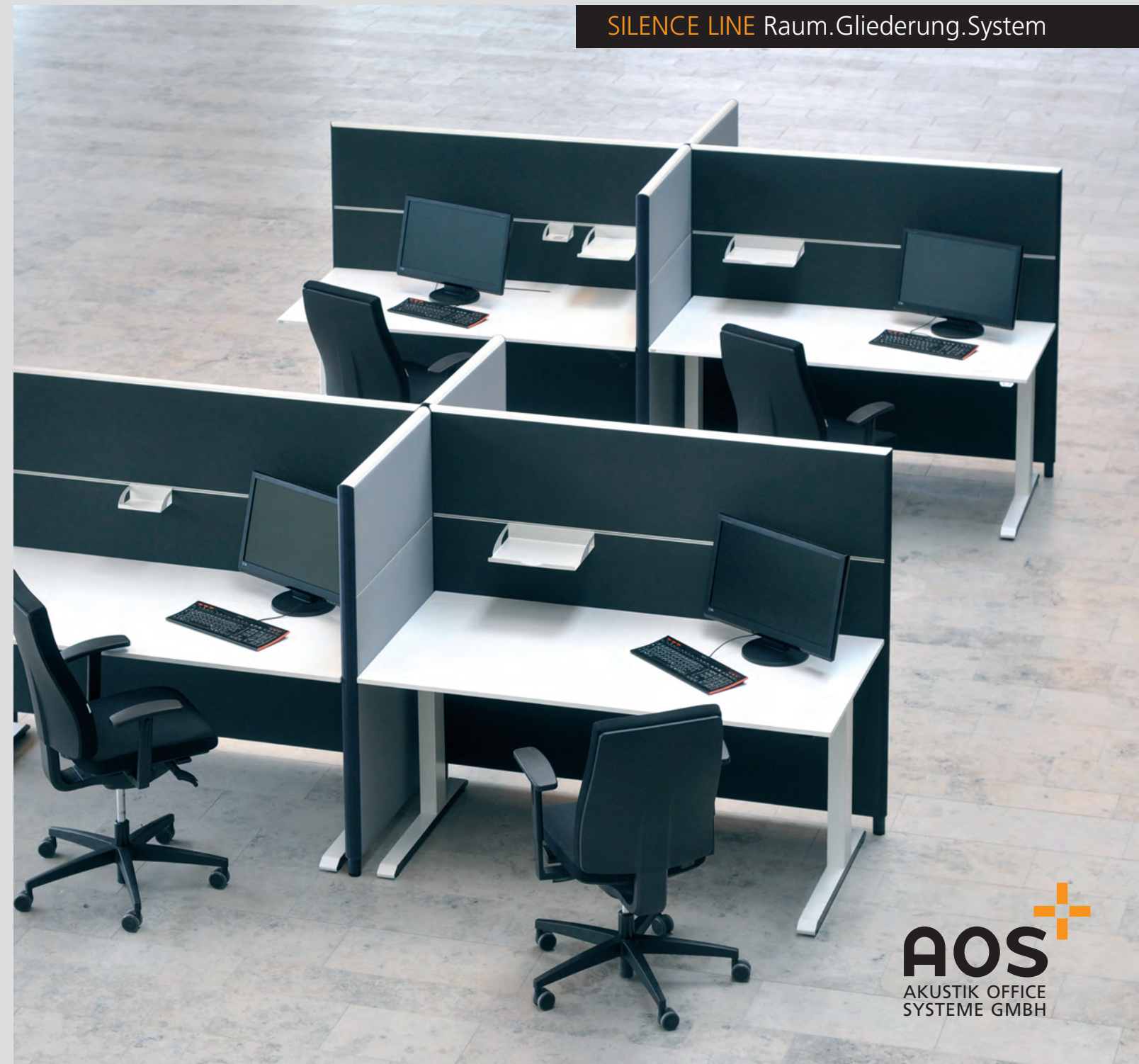
SILENCE LINE Raum.Gliederung.System

AOS Akustik Office Systeme GmbH Lenabergweg 5 91626 Schopfloch Telefon 09857 975210 Telefon 09857 975211 Telefax 09857 975212 info@akustik-office-systeme.de www.akustik-office-systeme.de